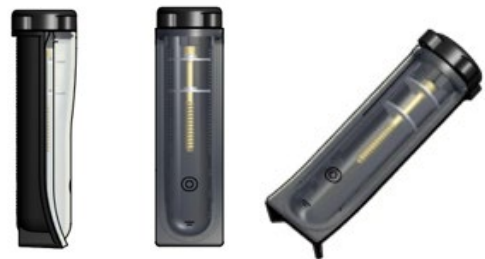
Spiedienliets iekšējais stobriņš