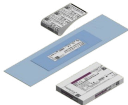
Maisiņa tipa iepakojums ar uzlīmēm, hermētiski noslēgtiem maisiņiem un kartona kārbu