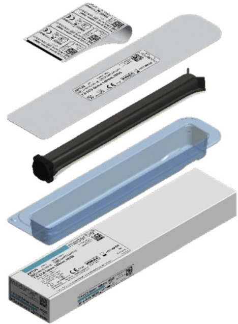
Blistera tipa iepakojums ar uzlīmēm, stobriņu, blisteri un kartona kārbu